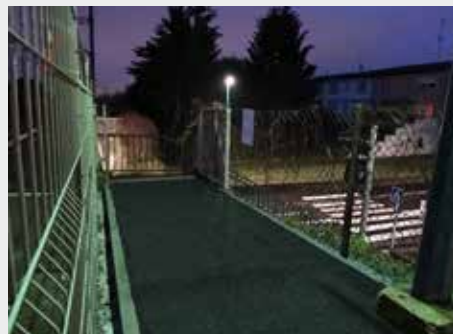
Les travaux de comblement du décrochement au niveau du haut de l'escalier d'accès au quai de Geispolsheim ont fini par être réalisés après de nombreuses demandes d'ASTUS.