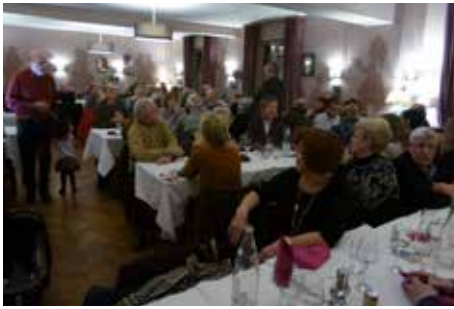
Le repas de la nouvelle année d'ASTUS a réuni plus de 60 de nos adhérents et le res-