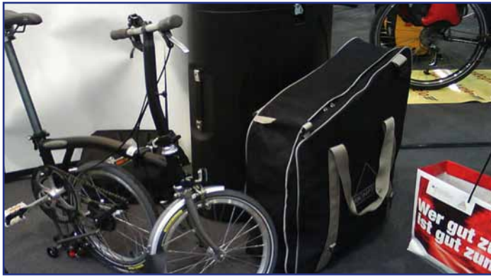
Un vélo pliant idéal pour l'intermodalité

Le premier samedi de février, quelques membres d'ASTUS se sont rendus à Karlsruhe pour visiter une exposition de cycles. Une participante témoigne : « J'étais contente de passer un bon moment avec d'autres personnes soucieuses elles aussi de réduire leur impact sur l'environnement en utilisant les transports en commun (merci ASTUS pour la prise en charge du billet combiné), contente aussi de découvrir des vélos originaux et pas si chers, mais un peu fatiguée d'avoir passé plus de 6h dans les transports pour si peu de kilomètres ! Bilan de cette journée : la documentation recueillie a servi lors de la Bourse aux Vélos de Molsheim le 1 er dimanche du printemps, et sur un plan personnel, j'ai eu envie de revenir à Karlsruhe en famille, un week-end en train. »