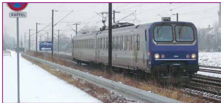
Un TER Strasbourg - Saverne passe sans arrêt à Mundolsheim

le collectif a obtenu l'instauration de cinq nouveaux arrêts en décembre 2008. Une année plus tard, quelques ajustements horaires permettent de meilleures correspondances en gare de Strasbourg. Néanmoins le compte n'y est pas. Ils espèrent très rapidement une amélioration des dessertes avec un cadencement de 30 minutes en période de pointe et d'une heure en période creuse.