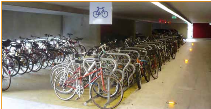
À chaque gare son parking vélo

La complémentarité est évidente en théorie, car l'utilisation de deux modes de transport cumule les avantages des deux et en minimise les inconvénients. Mais, en pratique, cette intermodalité nécessite adaptations et équipements.