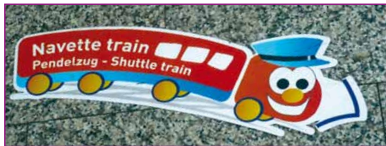
La navette tisse les relations

Les clients des bus et des trams ont intérêt à voir de nombreux automobilistes enfourcher un vélo, rendant ainsi la ville plus agréable et la circulation publique plus aisée. Les cyclistes voient d'un bon œil se développer les transports en commun qui siphonnent le trafic automobile et facilitent donc leurs déplacements. La satisfaction est commune, l'intérêt est mutuel.